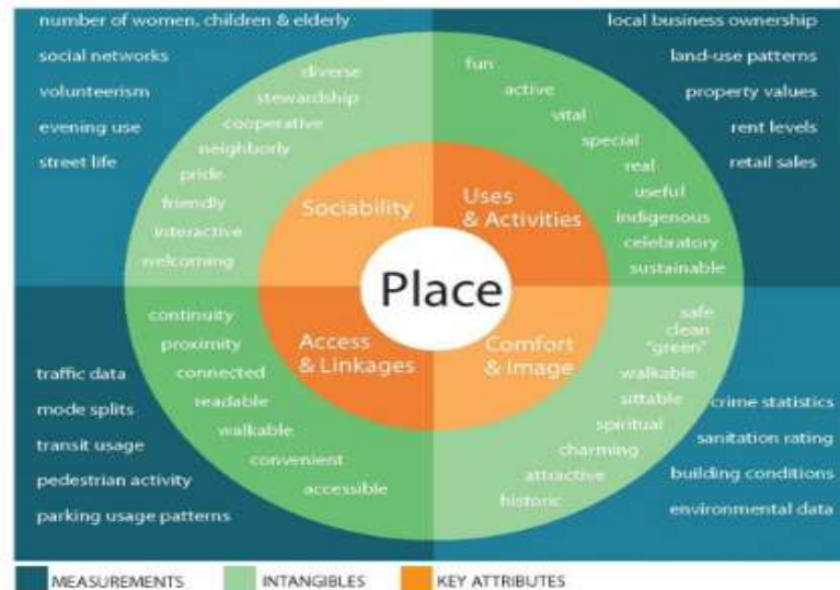
نمودار (3-1) دیاگرام یک مکان خوب

افراد در آنها درگیر فعالیت می شوند، راحت بوده و دارای مناظر زیبایی هستند، و در نهایت مکانی اجتماعی هستند، یعنی جایی است که افراد می توانند همدیگر را ملاقات کنند (Cholkoff/Thibaud /1993:58).