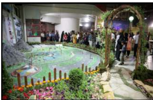
تصویر (3-6) جذابیت در فضا

فضاهای باز محله بایستی برای کودک و نوجوان برانگیزاننده و جذاب باشد. حد متعالی از پیچیدگی، تازگی، طراوت، تنوع و هیجان انگیز بودن را در محیط هایی چون بوستان کودک، ورودی مجتمع های مسکونی، معابر فرعی یا گذرهای پیاده و مرکز محله ضروری است تا کودکان را پایبند رویدادها و اتفاقات محیط محله کند در غیر این صورت آنها محیط های دیگر و فعالیت های دیگری را که ممکن است متناسب با سن رشد آنها نباشد ترجیح دهند. وجود مقداری ابهام، پیچیدگی و قابلیت جستجو و کشف ابعاد ناپیدای محیط محله در این زمینه تاثیر مطلوبی خواهد داشت.