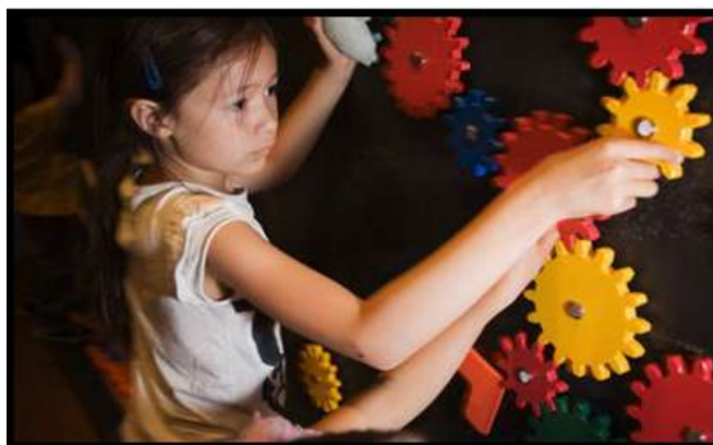
تصویر (3-5) کودکان و خلاقیت