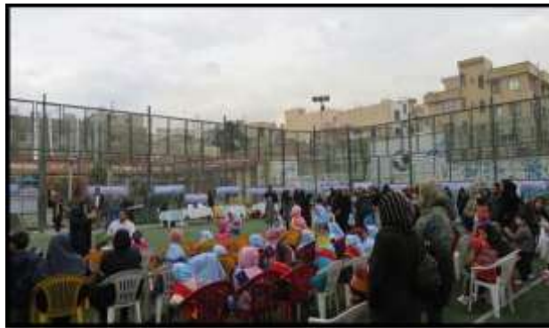
تصویر (۳-۳) کودکان و مشارکت

نیازهای کودکان و جوانان، علی الخصوص با توجه به محیط زندگیشان باید کاملا مورد توجه قرار گیرد. باید برای روندهای مشارکتی شکل دادن به شهرها، حومه ها و واحدهای همسایگی توجه ویژه قایل شود. این توجه جهت ایمن نمودن شرایط زندگی کودکان و جوانان با بهره گرفتن از بینش، خلاقیت و تفکراتشان راجع به محیط می باشد. باید کودکان را با مسایل تاثیر گذار بر آنها نسبت به شرایط سنی مشارکت داد (شارپ و کاوی، ۱۴: ۱۳۷۹).